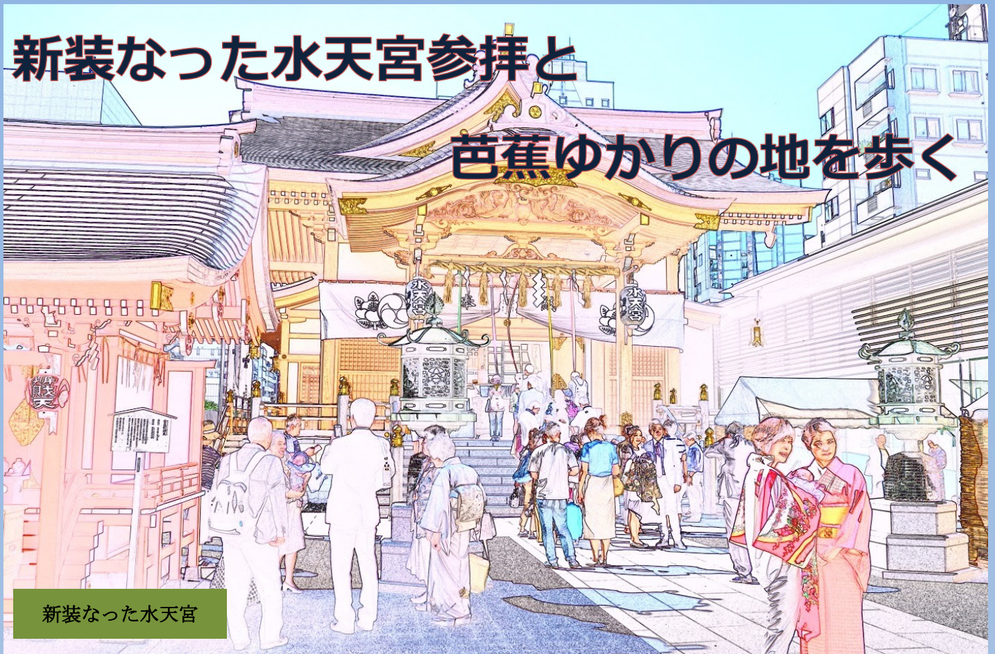
新装なった水天宮